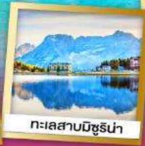
ทะเลสาบมิซูร์น่า