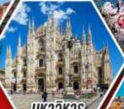
มหาวิหาร ดูโอโมแห่งมิลาน