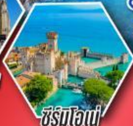
ซีร์มิโอเน่