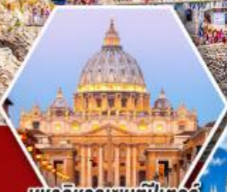
มหาวิหารเซนต์ปีเตอร์