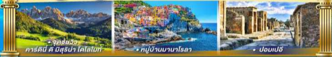
• จุดชมวิว คาร์ดินี คี บิสสุร่า โดโลไมท์