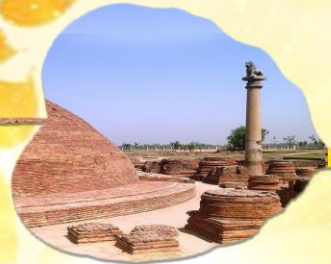
เมืองหลวงแคว้นอานาจักรวัชชี แคว้นชมพูทวีป