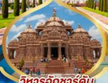
วิหารอักชาร์คัม