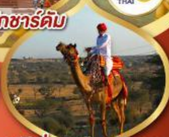
ฟรี जूजू เมืองมันทวา ราคาเริ่มต้น

05-10 มี.ค.68 12-17, 19-24 มี.ค.68 21-26, 26-31 มี.ค.68 28 มี.ค.-02 เม.ย.68