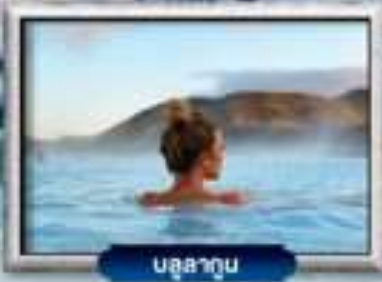
บรูสาถุน