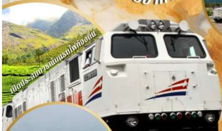
เมือง-สมุทรปราการไฟทอง