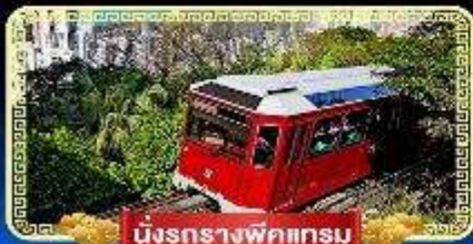
นั่งรถรางพิกเกรม

นั่งกระเช้ามองปิง 360 องศา บินลัดฟ้าไปมู..สู่เกาะฮ่องกง