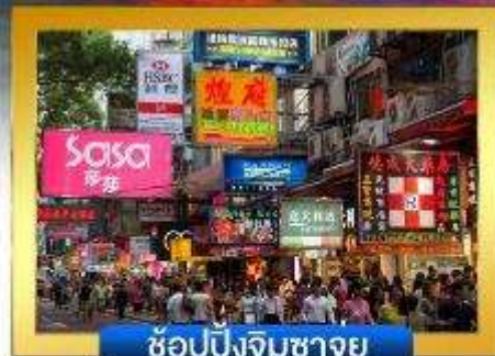
ช้อปปิ้งจิมซาจู้