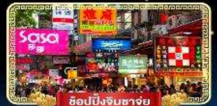
ช้อปปิ้งจิมซาจู้