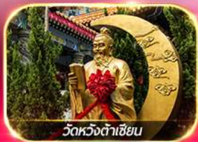
วัดหวงต้าเซียน