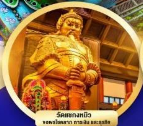
วัดแชกงหมิว vowsokeokam การเงิน และธุรกิจ