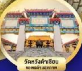
วัดหวังต้าเซียน ขอพรด้านสุขภาพ