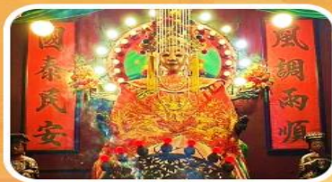
วัดเจ้าแม่กวนอิมเทียนทิว