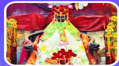
วัดเจ้าแม่กวนอิมสองฮ่า