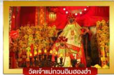
วัดเจ้าแม่กวนอิมฮองฮ่า