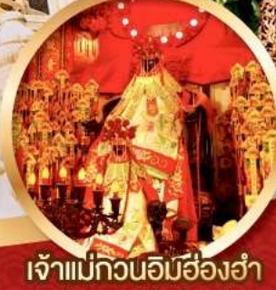
เจ้าแม่กวนอิมฮ่องฮ่า

นมัสการองค์เจ้าแม่กวนอิม อายุกว่า 600 ปี