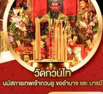
วัดกวนไท่

นมัสการองค์เจ้าแม่กวนอิม อายุกว่า 600 ปี