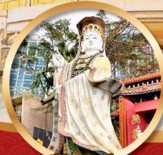
ริพัลส์เบย์