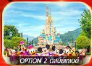
OPTION 2 ดิสนีย์แลนด์

เต็มอิ่ม ทั้งไหว้พระ-ขอพร การเงิน การงานความรักและซ่อมปัง