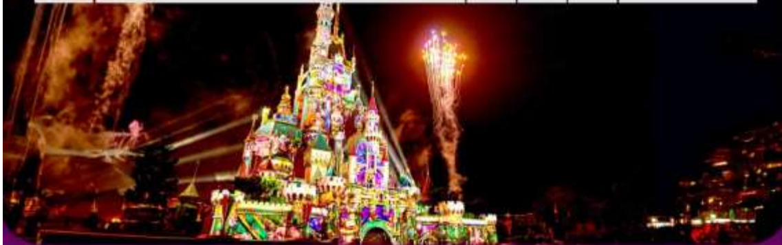
รายการทัวร์อาจมีปรับเปลี่ยนตามความเหมาะสม โดยดูสถานการณ์นำงานเป็นหลัก แต่จะเที่ยวครบทุกรายการ

โปรแกรมการเดินทาง 3 วัน 2 คืน : เดินทางโดยสายการบินเอมิเรตส์