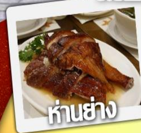
ค่านย่าง