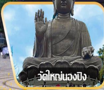
วัดใหญ่หนองบึง