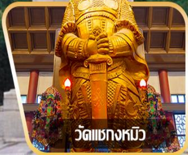
วัดเขangkงหิว