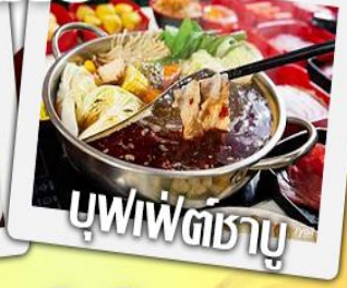
บุฟฟัตซาบู