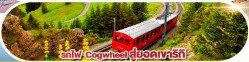
รถไฟ Cogwheel สู้ออดเวจาร์ก