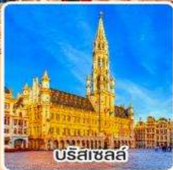
บรัสเซลส์