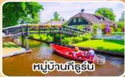
หมู่บ้านกังรีน