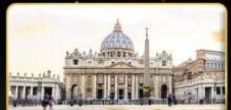
เซนต์ปีเตอร์