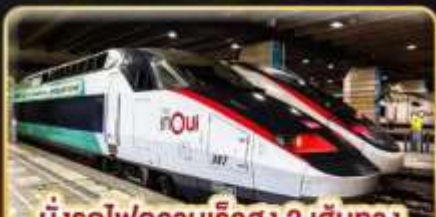
นั่งรถไฟความเร็วสูง 2 เส้นทาง PARIS - LYON & VENICE - ROME

📅 เดินทาง : 11-20 ก.พ. 68 / 15-24 มี.ค. 68 05-14 เม.ย. 68 / 29-08 พ.ค. 68