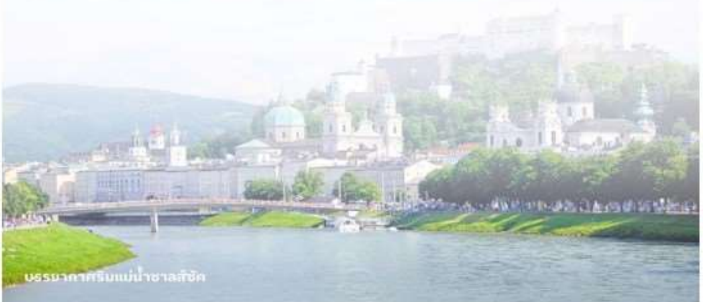
บรรยากาศริมแม่น้ำซาลส์บวร์ค

บริการอาหารค่ำ ณ กัตตาการ นำท่านเข้าสู่ที่พัก FourSide Salzburg หรือเทียบเท่า