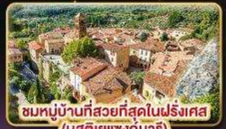
ชมหมู่บ้านที่สวยงามที่สุดในฝรั่งเศส (มูสติเยแซงก์มารี)