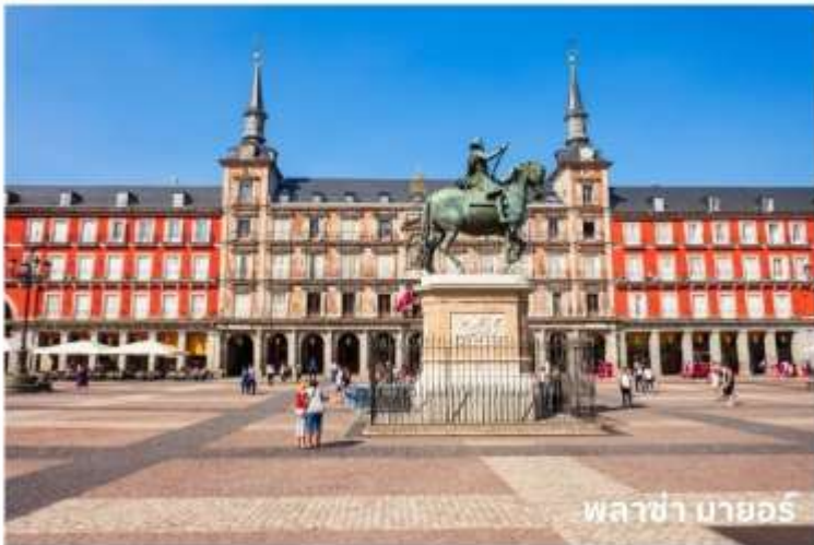
พลาซ่า มายอร์

จากนั้นนำท่านเดินทางสู่ กรุงมาดริด (Madrid) เมืองหลวงของประเทศสเปน ตั้งอยู่ใจกลางแหลมไอบีเรีย ในระดับความสูง 650 เมตร เป็นมหานครอันทันสมัยล้ำยุคที่กษัตริย์ฟิลลิปที่ 2 ได้ทรงย้ายที่ประทับจากเมืองโทเลโดมาที่นี้และประกาศให้มาดริดเป็นเมืองหลวงใหม่ ยกเว้นในช่วงประมาณปี ค.ศ. 1601-1607 เมื่อพระเจ้าฟิลลิปที่ 3 ได้ย้ายเมืองหลวงไปที่เมืองวัลลาโดลิด มาดริดได้ชื่อว่าเป็นเมืองหลวงที่สวยงามที่สุดแห่งหนึ่งในโลกและสูงสุดแห่งหนึ่งในยุโรป จากนั้นผ่านชม น้ำพุไซเบเลส (Cibeles Fountain) ที่สร้างอุทิศให้แก่เทพธิดาไซเบลิน เป็นสถานที่ที่ใช้ในการเฉลิมฉลองในเทศกาลต่างๆของเมือง และนำท่านเดินทางสู่ พลาซ่า มายอร์ (Plaza Mayor) ใกล้เคียง เขตปูเอตาเดลซอล หรือประตูพระอาทิตย์ ซึ่งเป็นจุดศูนย์กลางเมือง นับเป็นจุดนัดภักโกลเมตรแรกของสเปน (กิโลเมตรที่ศูนย์) และยังเป็นศูนย์กลางรถไฟใต้ดินและรถเมล์ทุกสาย นอกจากนี้ยังเป็นจุดตัดของถนนสายสำคัญของเมืองที่หนาแน่นด้วยร้านค้าและห้างสรรพสินค้าใหญ่มากมาย