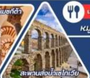
สะพานส่งน้ำเซโกเวีย