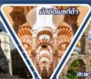
มิสยิดเมซquita