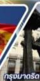
กรุงมาดริด

✓ เข้าชมพระราชวังหลวง การแสดงระบำฟลามงโก้ เข้าอัลฮัมบลา (GENERALIFE) เข้าชมซากราดาฟามีเลีย เข้าชมมิสยิดเมซquita