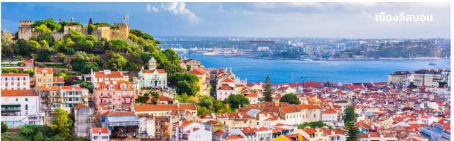
เมืองลิสบอน

นำท่านเข้าสู่ที่พัก Sana Metropolitan หรือเทียบเท่า