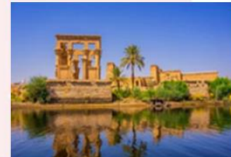
วิหารฟิเล

16.25 น. ออกเดินทางสู่กรุงโคโร สายการบิน Egypt Airlines เที่ยวบิน MS295