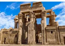
วิหารคอมมอโบ