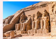
มหาวิหารอาบูซิมเบล

** พักที่ JAZ Crown Jewel Nile Cruise 4* หรือเทียบเท่า **