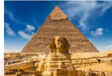
มหาพีระมิดกิซา