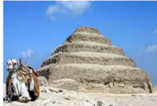
พีระมิดชั้นบันได