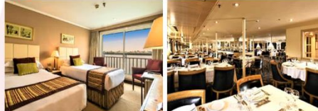
เรือสำราญแม่น้ำไนล์

** พักที่ JAZ Crown Jewel Nile Cruise 4* หรือเทียบเท่า **