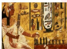
หุบผากษัตริย์

** พักที่ JAZ Crown Jewel Nile Cruise 4* หรือเทียบเท่า **