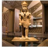
The Egyptian Museum

** พักที่ Mamlouk Pyramids Hotel 4* หรือเทียบเท่า **