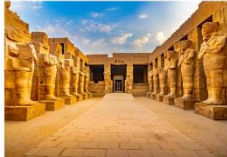
มหาวิหารคาร์นัค

** พักที่ JAZ Crown Jewel Nile Cruise 4* หรือเทียบเท่า **