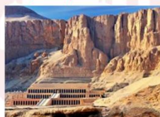
วิหารฮัคเซฟซุต

** พักที่ JAZ Crown Jewel Nile Cruise 4* หรือเทียบเท่า **