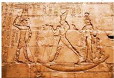
วิหารเอ็ดฟู