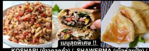
เมนูสุดพิเศษ !! KOSHARI (ข้าวคลุกถั่ว) / SHAWERMA (เนื้อห่อแป้ง) / FITEER BALADI (พิซซ่าอียิปต์)