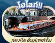
ล่องเรือ อัมสเตอร์ดัม

“ตำนานเด็กยืนชี้ สัญลักษณ์แห่งกรุงบรัสเซลส์ แมนเนเกน พิส มหาวิหารโคโลญ” สะพานไอเอ็นชอลเลิร์น ล่องเรือชมหมู่บ้านทีโรน กังหันลมชาลส์คันส์ คลองอัมสเตอร์ดัม บรัสเซลส์ อะโตเมียม จัตุรัสบรูจส์ หอไอเฟล จัตุรัสคองคอร์ด พิพิธภัณฑ์ลูฟร์ ล่องเรือแม่น้ำแซน ซุปปิ้งแบบจิวอี้ที่ห้างซินน่า