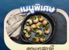
ของแถมพิเศษ

เดินทาง 9 - 16 พ.ค.68 19 - 26 พ.ค.68 26 พ.ค. - 2 มิ.ย.68