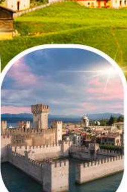
ซิร์มีโอเน