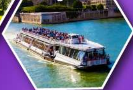
ล่องเรือบาโตมูซ ชมกรุงปารีส

เที่ยวเมืองวาอูซ เมืองหลวงของสาธารณรัฐ ลิกเทินสไตน์