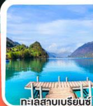
ทะเลสาบเบเรียนซ์