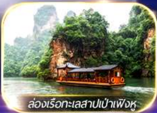
ล่องเรือทะเลสาบเป่าเฟิงหู