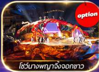
โชว์นาฏพญางิ้งจอกขาว