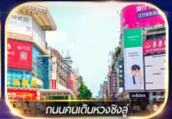
ถนนคนเดินหวงซิงสู๋

ล่องเรือชมเมืองโบราณ ฟุรงเจิน + ทะเลสาบเป่าเฟิงหู