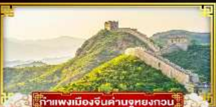
กำแพงเมืองจีนด่านซุยกวง