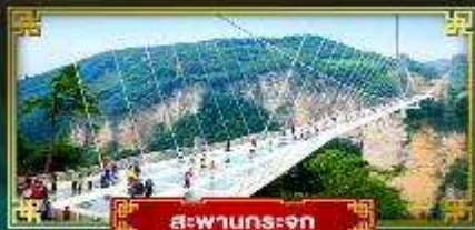
สะพานกระจก

สัมผัสบรรยากาศหมู่บ้านโบราณ ชมหุบเขาอวตาร