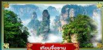
เทียนจ้อซาน