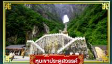
อุทยานประตูสวรรค์