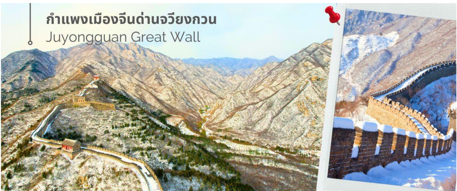
กำแพงเมืองจีนด่านจวิรงกวน Juyongguan Great Wall

แวะชมสินค้าร้านบัวหิมะ (ร้านรัฐบาลจีน) จากนั้นนำท่านเดินทางชมความยิ่งใหญ่ของ กำแพงเมืองจีนด่านจวิรงกวน (Juyongguan Great Wall) หรือที่รู้จักกันในชื่อ ป้อมจวิรง เป็นด่านที่ใกล้กับใจกลางกรุงปักกิ่งมากที่สุด ราว 50 กิโลเมตร เท่านั้น นับเป็นหนึ่งในด่านสำคัญและเป็นสัญลักษณ์ของกำแพงเมืองจีน มีความยาวราว 4 กิโลเมตร ตั้งอยู่ทางทิศตะวันตกเฉียงเหนือของกรุงปักกิ่ง สร้างขึ้นในสมัย จีนซีฮ่องเต้ กำแพงนี้ตั้งอยู่ในหุบเขา Guangou ทำให้มีชื่อได้เปรียบโดยธรรมชาติคือสามารถ "ยึดครองได้ง่าย แต่โจมตีได้ยาก" ถือว่าเป็นหนึ่งในจุดเริ่มต้นของกำแพงเมืองจีนในภาคเหนือ ซึ่งสร้างขึ้นเพื่อป้องกันกรุงปักกิ่งการรุกรานจากชนเผ่าเร่ร่อน ด่านจวิรงกวนมีสถาปัตยกรรมที่สวยงามของศิลปะจีน จากยอดด่าน สามารถมองเห็นทิวทัศน์ที่สวยงามของเทือกเขาและธรรมชาติโดยรอบ นับว่าเป็น 1 ใน 8 จุดชมวิวที่มีชื่อเสียงของปักกิ่งมาตั้งแต่สมัยราชวงศ์จิ้น จากนั้นนำท่านแวะชมสินค้าร้านหมอนยางพารา