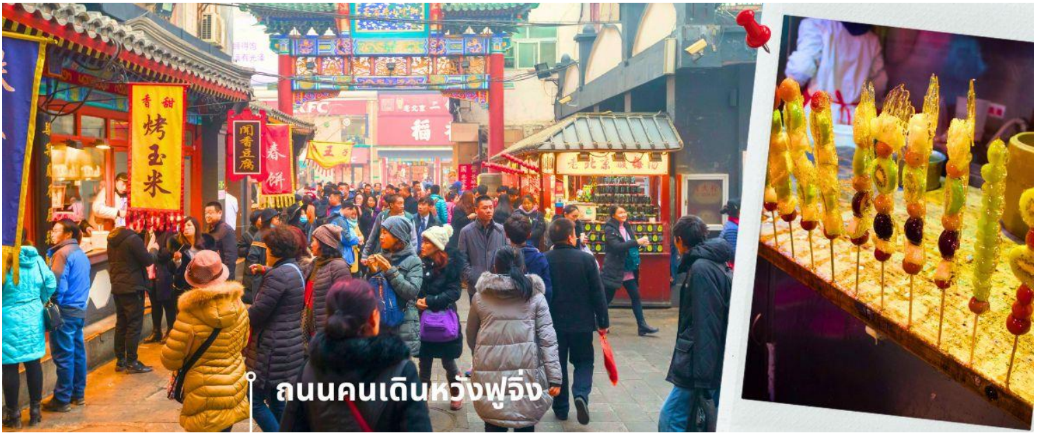
ถนนคนเดินหวังฟูจิ่ง

นำท่านเข้าสู่ที่พัก HOLIDAY INN EXPRESS HOTEL ★ ★ ★ ★ หรือเทียบเท่า