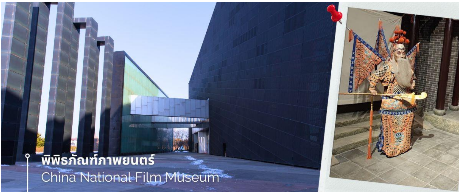
พิพิธภัณฑ์ภาพยนตร์ China National Film Museum

จากนั้นนำท่านชม วัดลามะ(Yonghe Temple) หรือ วัดยงเหอ เป็นวัดพุทธแบบทิเบตที่ใหญ่ที่สุดแห่งหนึ่งในประเทศจีน มีประวัติศาสตร์อันยาวนาน ตั้งอยู่ใจกลางกรุงปักกิ่ง เนื้อที่กว่า 6 หมื่นตารางเมตร โดดเด่นด้วยสถาปัตยกรรมที่งดงาม วิจิตรบรรจง สร้างขึ้นในสมัยราชวงศ์ชิง เมื่อปี ค.ศ. 1744 เดิมทีเป็นพระราชวังขององค์ชายสี่ บางครั้งจึงเป็นที่รู้จักในชื่อว่า วัดองค์ชายสี่ ต่อมาได้ปรับเปลี่ยนเป็นวัดพุทธแบบทิเบต โดยได้รับอิทธิพลจากศาสนาพุทธนิกายนิกายเกลุกปา ซึ่งเป็นนิกายที่สำคัญในทิเบต ที่นี้ไม่เพียงแต่เป็นสถานที่สำคัญทางศาสนาเท่านั้น แต่ยังเป็นสัญลักษณ์ของการผสมผสานวัฒนธรรมจีนและทิเบตได้อย่างลงตัว