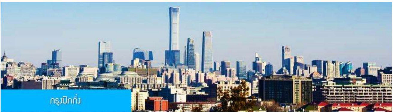
กรุงปักกิ่ง