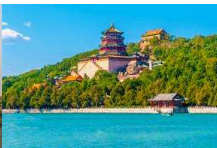
พระราชวังฤดูร้อนหยี่เหอหยวน