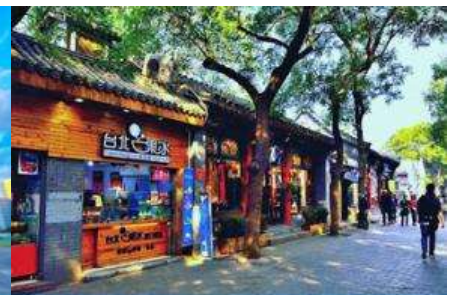
ชอยหนานหลัวกู่เซียง