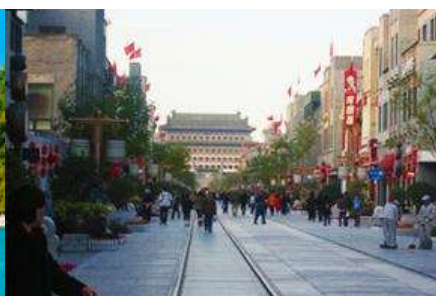
ถนนเวียนเหมิน