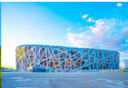
สนามกีฬาโอลิมปิก