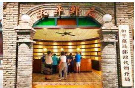
เมืองโบราณจำลอง