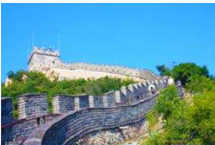
กำแพงเมืองจีนด่านฉวิยงกวน

พักที่ JINGLIN HTL OR HOLIDAY INN EXPRESS HTL 4* หรือโรงแรมในระดับเดียวกันในกรุงปักกิ่ง