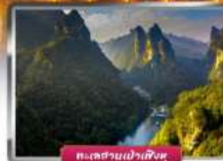
ทะเลสาบเป่าเฟิงหู