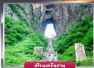
เทียนจินซาน