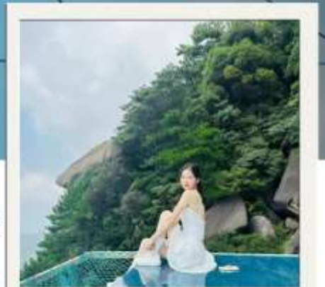
MIRROR OF THE SKY

จากนั้นนำท่านถ่ายรูปเช็คอินกับกระจกแห่งท้องฟ้าเป็นกระจกบานใหญ่ที่ถูกจัดวางเอาไว้ให้ทุกท่านได้วิวภาพถ่ายสุดอลังการและสนุกไปกับการโพสในท่าทางที่หลากหลายพร้อมทั้งสามารถมองบรรยากาศโดยรอบได้สุดสายตามีความรู้สึกเหมือนอยู่บนเมฆเลยทีเดียว