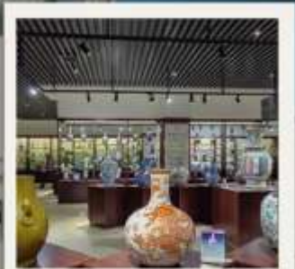
JINGDEZHEN CERAMIC MUSEUM