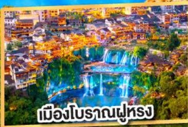
เมืองโบราณฟูหรง