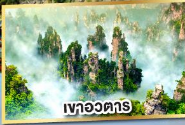
เขาอวดตาร