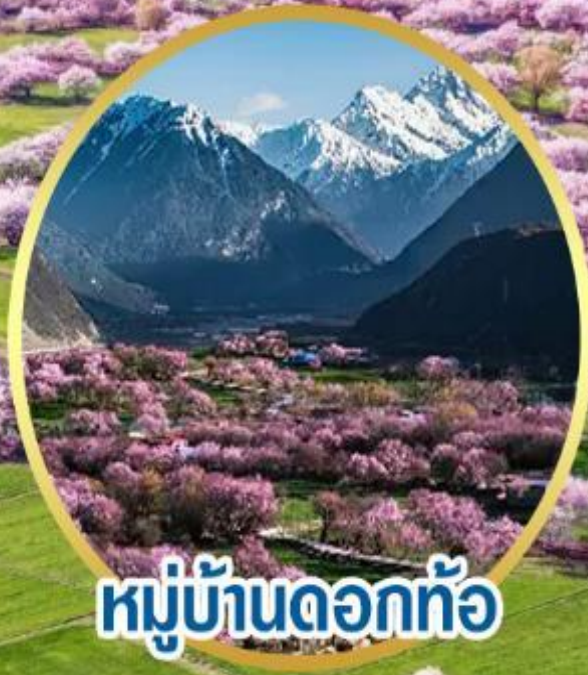
หมู่บ้านดอกท้อ