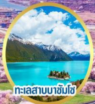
ทะเลสาบบาซิมโซ