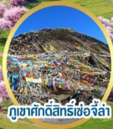
กุเขาศิกัดัสถร์เซอจีลา