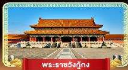
พระราชวังตงกิง