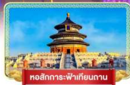
หอสังการะฟ้าเทียนถาน