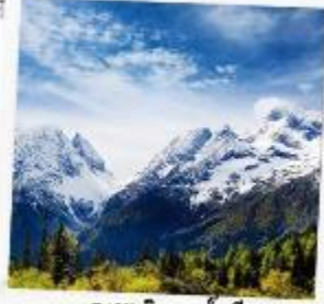
ภูเขาหิมะการ์เซีย ตำกู่ปิงชวง