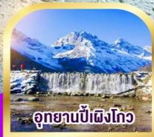
อุทยานปีติงโกว