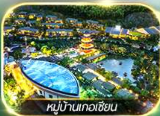
หมู่บ้านเกอเซียน