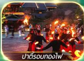
ปาตีรอกองไฟ