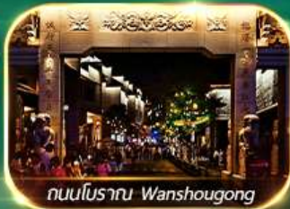
ถนนโบราณ Wanshougong

ตระการตาหุบเขาเทวดาฉีเจียงกู่ เช็กอินที่เที่ยงใหม่