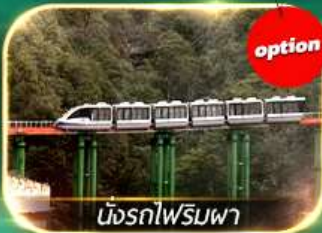
นั่งรถไฟเร็ว