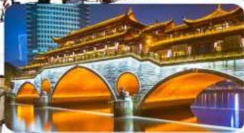
เมืองโบราณตุเจียงเยียน