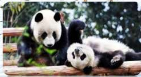
ศูนย์วิจัยหมีแพนด้า

เมนูพิเศษ สุกี้หม่าล่า บุฟเฟ่ต์ 6 วัน 5 คืน เดินทาง : ก.พ. – มี.ค. 68