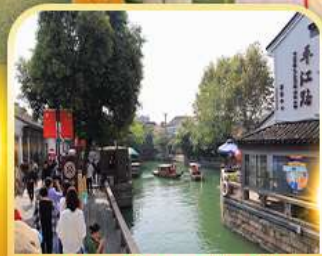
ท่องเที่ยวโบราณผิงเจียง

5 - 9 ก.พ. 2025 19-23 ก.พ. 2025 26 ก.พ.-2 มี.ค. 2025