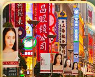
เดินเล่นถนนหนานจิง