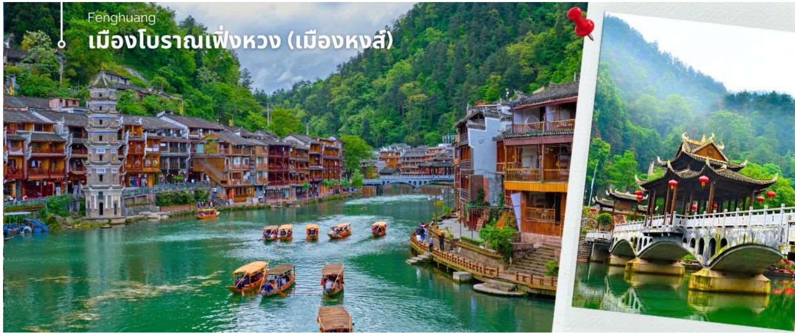
เป็นสัญลักษณ์ที่โดดเด่นของเมืองโบราณแห่งนี้

เมื่อเดินทางถึง เมืองโบราณเฟิ่งหวง เปลี่ยนเป็นรถของอุทยานเฟิ่งหวง นำท่าน นั่งเรือพายล่องแม่น้ำถั่วเจียง ชมบ้านเรือนโบราณห้อยขาสองฝั่งแม่น้ำถั่วเจียงอันเป็นเอกลักษณ์ของเมืองโบราณแห่งนี้ สัมผัสวิถีชีวิตที่ของชนเผ่าพื้นเมืองที่อาศัยอยู่บริเวณชุมชนนี้มาช้านาน เช่นชาวบ้านที่อาบน้ำ ซักผ้า หรือล้างผักอยู่ริมฝั่งแม่น้ำ บางครั้งท่านอาจได้เห็นชาวบ้านพายเรือไปร้องเพลงพื้นเมืองไป ช่างเป็นบรรยากาศที่สร้างมนต์เสน่ห์ดึงดูดผู้มาเยือน สำหรับชุมชนชนบทแห่งนี้เลยทีเดียว ชมสะพานหงเจียว สะพานไม้โบราณที่มีหลังคาคลุมเหมือนสะพานข้ามคลองในเวนิส สะพานแห่งนี้เคยเป็นด่านเก็บภาษีเกลือในสมัยราชวงศ์ชิง ซึ่งยังคงรักษารูปทรงในอดีตไม่เปลี่ยนแปลง ชมจัตุรัสหงส์ ที่มีรูปนกหงส์จำลองที่ทำจากทองเหลือง อัน