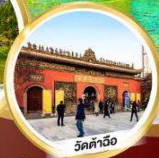
วัดต้าฉิว