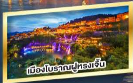
เมืองโบราณฝูหลงเจิ้น