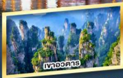
เขาหวอดาร