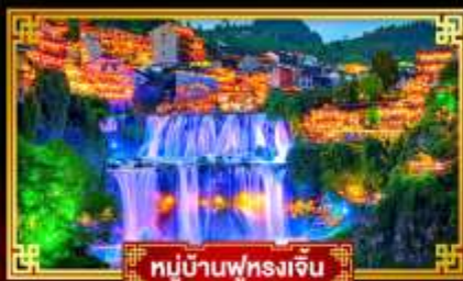
หมู่บ้านฟูหลงเจิ้น