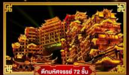
ตึกมหิศจจรณ์ 72 ชั้น